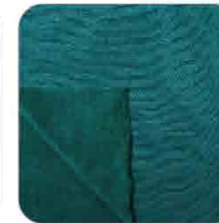
Vải Nữ Vẩy Cá Tạo Hạt