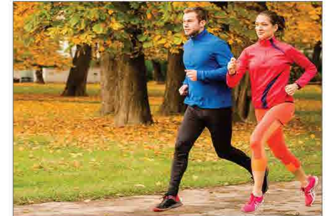
Đồ chạy bộ