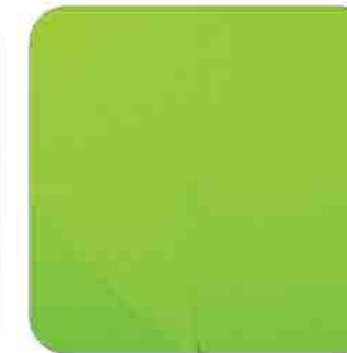
Vải thun interlock