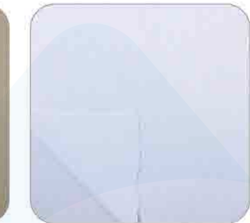
Vải Thun Mè