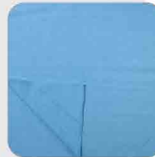
Vải Da Cá 4C