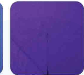
Vải Thun Cá Sấu