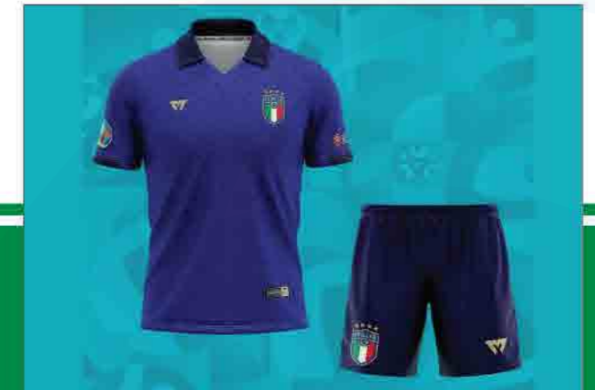
Đồ đá bóng