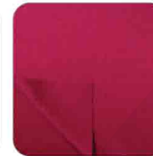
Vải Thun 2 Da