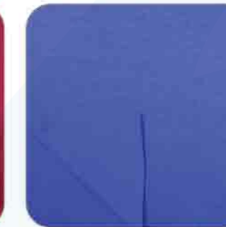
Vải Cá Sấu Mè