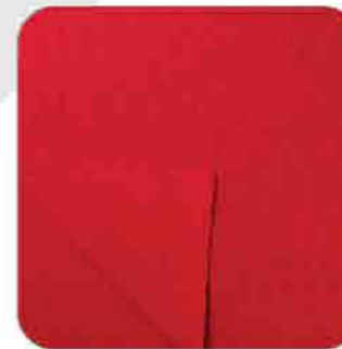
Vải Rib 2x1