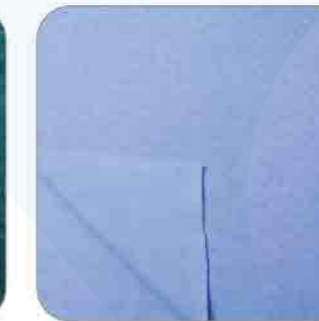
Vải Nữ Cào