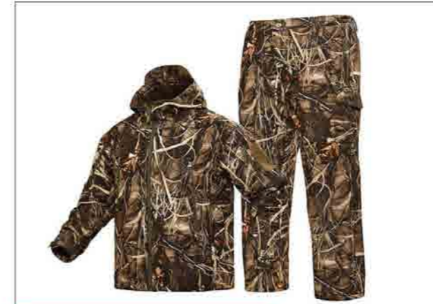
Đồ đi săn