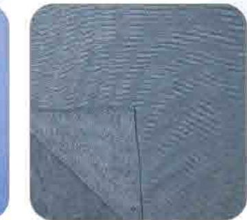
Vải Khăn Lông