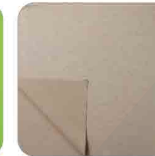
Vải Thun Single