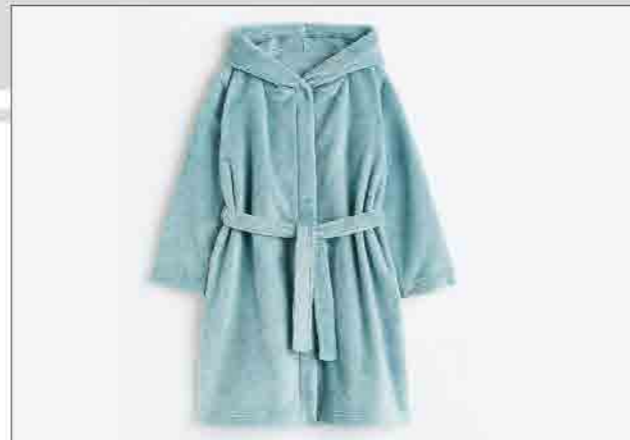
Áo ngủ khách sạn